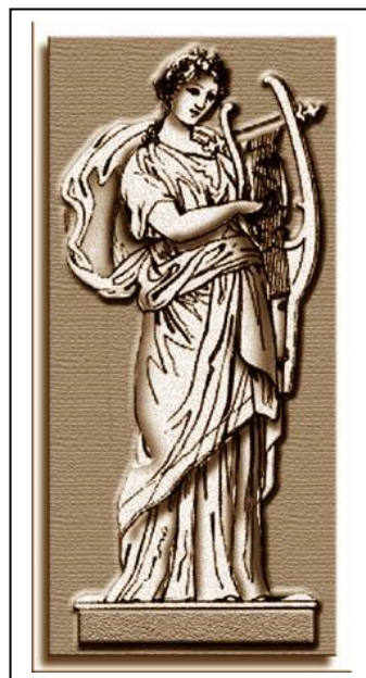
Erato, Musa de la poesía lírica

La siguiente generación de poetas, en la primera mitad del s. I a. C., es la que se agrupa bajo el nombre de poetas nuevos ( poetae novi ) o neotéricos ( neoterói ), expresiones con las que Cicerón se refirió a ellos con cierto desprecio. Sus composiciones breves (el epilio , es la principal muestra), de gran perfección técnica y de gran belleza formal y estilística presentan la marca del influjo alejandrino: «el arte por el arte». Escribieron poemas siguiendo la moda helénica, pero teniendo una preocupación exquisita por cuidar la forma; estos jóvenes poetas rebeldes rompían los moldes establecidos y, en un tiempo en el que estaba de moda escribir largos poemas épicos de temas patrióticos, hablaban de amores personales y reales y de hechos cotidianos en poemas cortos y de métrica variada, siendo acusados de superficiales.