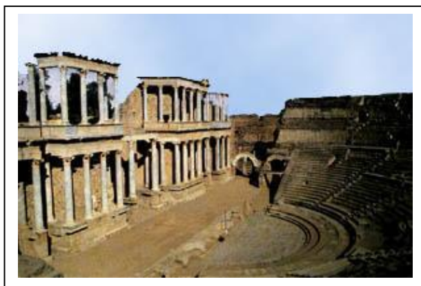
Teatro romano de Mérida