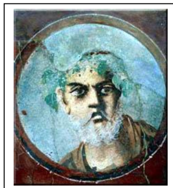
Retrato de Terencio en un fresco pompeyano