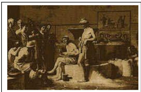
Plauto leyendo sus comedias

Terencio toma de Menandro una visión del mundo menos ruda que la que imponía la antigua virtus , y con él, por sus conocimientos literarios, por sus gustos elevados, por su estilo elegante alejado de toda vulgaridad, comienza a surgir el concepto de humanitas . El propio poeta lo resumió admirablemente en su conocidísimo verso de su obra Heautontimoroumenos : ' Homo sum: humanum nil alieni puto '.