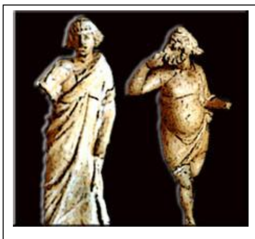
Figuras de terracota que componen una escena de comedia.